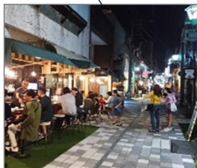
道路を占用した夜間オープンカフェ (福岡県北九州市)