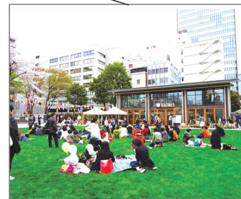
公園を芝生や民間カフェ設置で再生 (東京都豊島区)