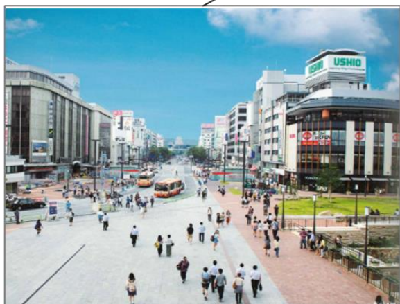
駅前のトランジットモール化と広場創出(兵庫県姫路市)