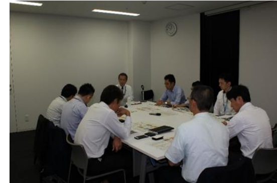
【中部ブロック サウンディング会場の様子】