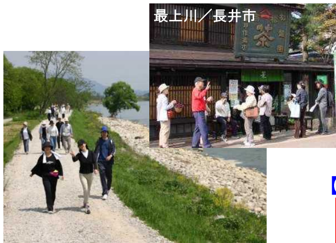
管理用通路をフットパスとして活用 (最上川)

治水上及び河川利用上の安全・安心に係る河川管理施設の整備を通じ、まちづくりと一体となった水辺整備を支援