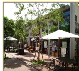
1階をガラス張りの店舗にリノベーションするとともに、民間敷地の一部を広場化。（宮崎県日南市）