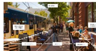
ポートランド (PEARL DISTRICT/パール地区)