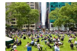
ニューヨーク (ブライアント・パーク)