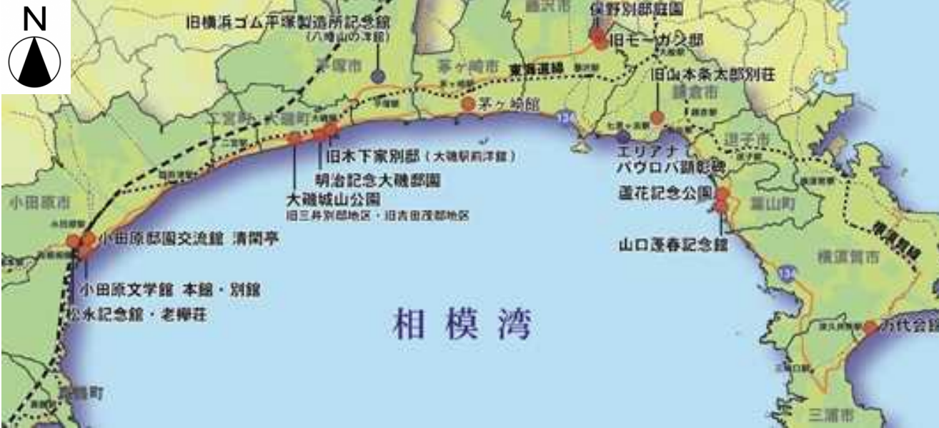
明治記念大磯邸園（整備中）