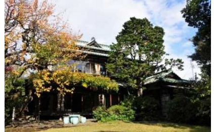
松永記念館・老櫓荘