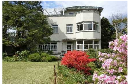
小田原文学館別館