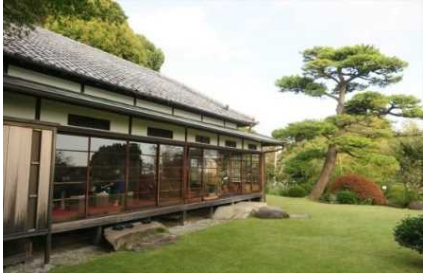
小田原文学館本館