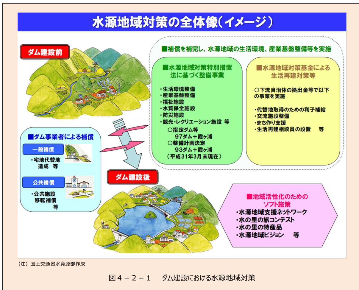
図4-2-1 ダム建設における水源地域対策

水源地域対策には、①ダム事業者による補償、②水源地域対策特別措置法に基づく措置、③水源地域対策基金による生活再建対策等、④水源地域活性化のためのソフト施策(第6章3)の4つの柱があり、相互に補完し合い、総合的な対策が講じられている(図4-2-1)。