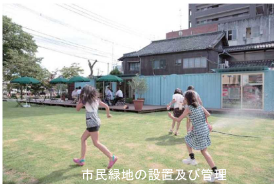
市民緑地の設置及び管理