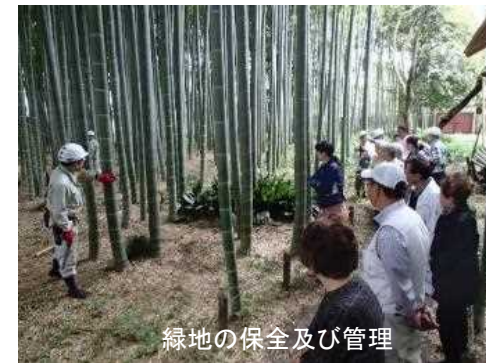
緑地の保全及び管理