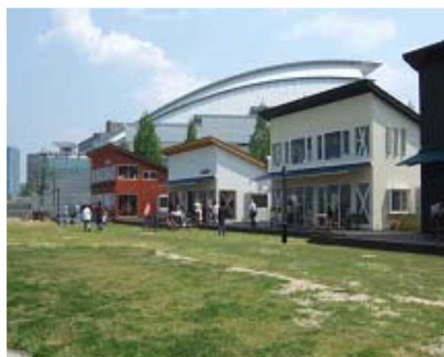
都市公園を活用したオープンカフェ事業を行っているまちづくり会社