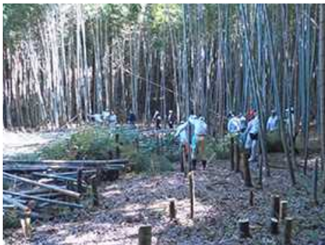
CSR活動として里山保全活動に参加する民間会社