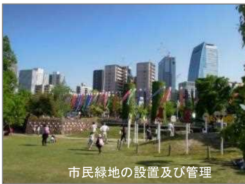
市民緑地の設置及び管理