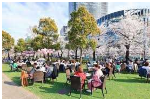
再開発等で創出された緑地空間を管理するマネジメント会社