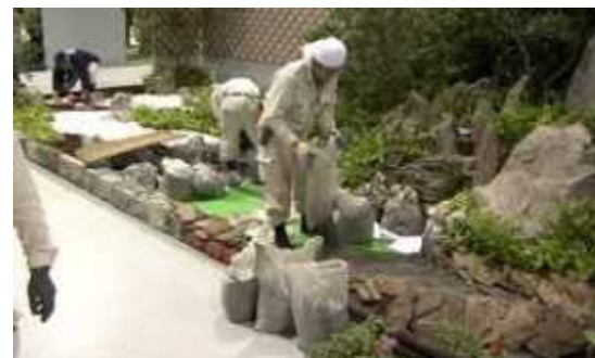
庭園や公園の施工・管理を担う造園会社