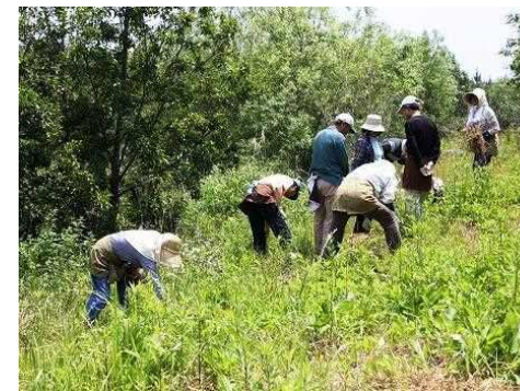
都市公園の指定管理業務を行っている指定管理者