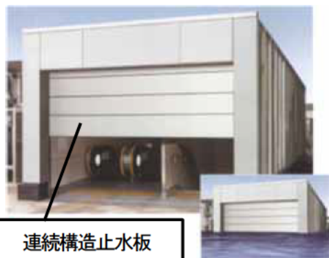
写真 1 シャッター型設置例

これらの浸水防止用設備のうち、建具型（シャッター及びドア）と呼ばれる製品については、所有者・管理者が設置場所に適した浸水防止用設備を選択し、製品の比較が可能となるよう JIS で品質基準を規定しました。