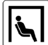
【カームダウン・クールダウン】