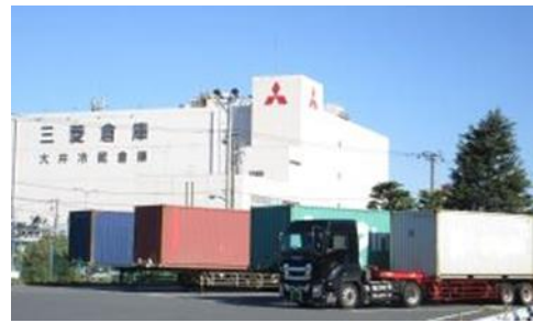
既存ストックヤードの様子（大井）