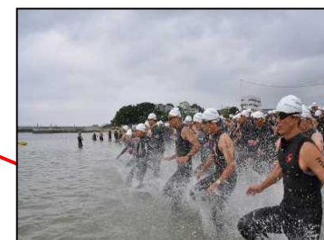
里海トライアスロン(7月)