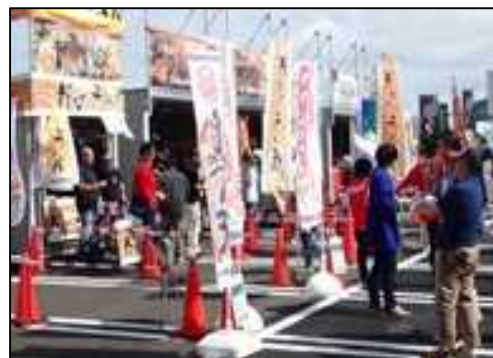
「みなとオアシス」における地域振興イベント