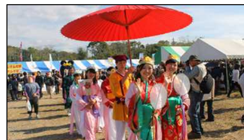
宮子姫みなとフェスタ