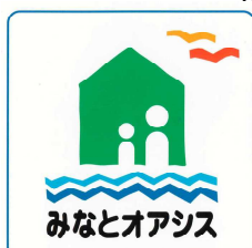
みなとオアシス標章（シンボルマーク）

※ みなとオアシス： 旅客船ターミナル、文化交流施設、みなとの資料館、情報提供施設、地元産品の物販施設や飲食施設などで構成されています。「みなとオアシスごぼう」の詳細は別紙－1、「みなとオアシス」の詳細は別紙－2をご参照願います。