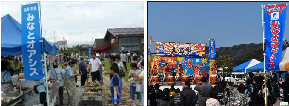
「みなとオアシス」における地域振興イベント