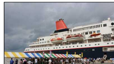
大型客船「にっぽん丸」寄港