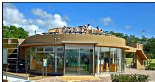
日高港新エネルギーパーク