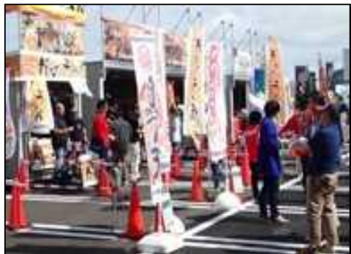
「みなとオアシス」における地域振興イベント