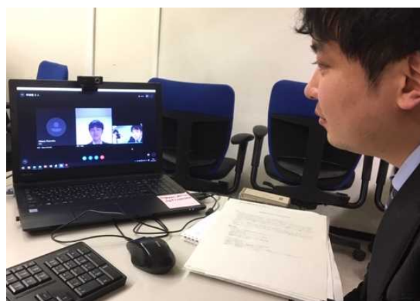
ライブ配信型説明会の実施状況 (政策ブリッジ(R2/3/2開催))