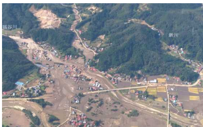
令和元年東日本台風による被害 (宮城県伊具郡丸森町)