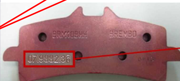
交換対象となる 製造番号