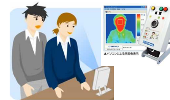
熱感知カメラ設置による感染者の公共交通利用自粛励行