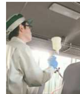
車内の抗菌・抗ウイルス対策