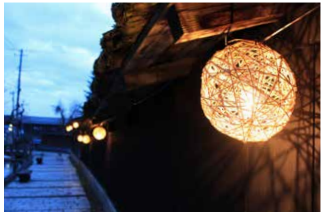
大堰公園に面した住宅の杉板堀に灯るランプシェード 歩行者を誘導し、水路に光が映り込む