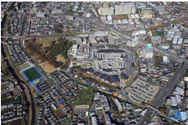
地区全景 官民連携・共同でスーパーブロック化し 駅直結で商業街区と都市公園が融合した

当地区は、既存の商業施設の再整備に伴い、街の構造を全面的に見直し官民一体となってシームレスな街を創った画期的計画である。従前は、ごく一般的な民間鉄道駅に接したアウトレットモールやシネコンなどであり、ショッピング目的の自動車による来街者も多い反面、周辺街区や隣接する都市公園などの関連性は皆無に近かった。こうした状況に対して、既存道路によって大きく分断されていた街区構造を抜本的に見直し、道路の付け替えによって各街区一体的につなげたことは特筆に値する。特に商業と都市公園の間に「パークライフ・サイト」と名付けられた高品質な接続空間を整備したことが、今回の大臣賞評価につながるものとなった。「パークライフ・サイト」はもとも大きな法面と道路によって分断されていた場を、文化施設や市民施設などを整備し連続的な空間としたものである。これによって、従来は訪れる人も稀であった都市公園に活力を与えた。また、これとつながる商業施設においても、周辺街区と平面的に分断されていた駐車場を立体的に再配置し、回遊型ショッピングモールの中に封じ込めた計画は巧みである。今後整備される予定の都市型住宅や複合利用ゾーンの完成によって、更に質の高い都市空間が形成されることを期待したい。（田中）