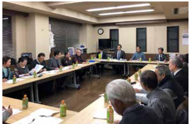
建替え調整協議会 事業者と地域住民と専門家が協議する