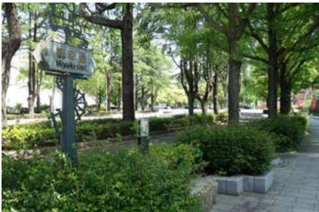
御幸通から市役所方面を望む 豊かな街路樹が四季折々の姿を見せる