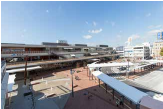
徳山駅前賑わい交流施設（写真中央）と前面に広がる北口駅前広場

戦災により甚大な被害を受けた街はその後の土地区画整理事業によって復興を遂げ、現在の骨格となる街並みを形成してきた。当地区は駅、目抜き通り、商業地区を中心に街の発展を担ってきたが、郊外型大型店の進出などにより空洞化し求心力を失っていた。この状況に取り組むため官と民が横断的に支援、提案、助言など積極的な交流を行ってきた。市は駅の南北自由通路、賑わい交流施設、駅前広場の事業を推進。クオリティの高い中心施設を整備し緑豊かな都市軸とその一帯の景観的連携を実現した。県内で初めて景観整備機構に指定された建築士会は守る、育てる、楽しむをキーワードに景観の保全、色彩のルール、街のアクティビティなどについて提言を続けてきた。中心市街地活性化協議会はマルシェ、クリーンプロジェクト、マナーアップなどに長年取り組んできた。地区の中核を成す賑わい交流施設と駅前広場は巧みに連携したデザインで高い水準にあり、年間 200 万人の来場、280 回に及ぶイベント開催につながっている。このように新旧の施設と継続的な活動が景観形成に大いに貢献していると評価され今回の受賞につながった。(富田)