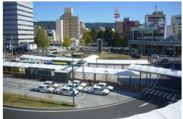
徳山駅前賑わい交流施設から北口駅前広場（写真下）、御幸通（写真中央）を望む