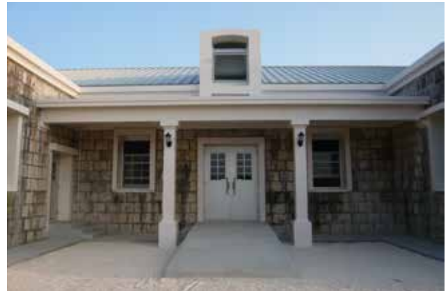
燐鉱山の近代化遺構（旧東洋製糖出張所）を 保存・復元した「りんこう交流館」