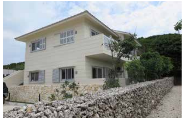
燐鉱山時代の社宅をモチーフに設計した 漁師用の定住促進住宅（通称：うみんちゅ住宅）