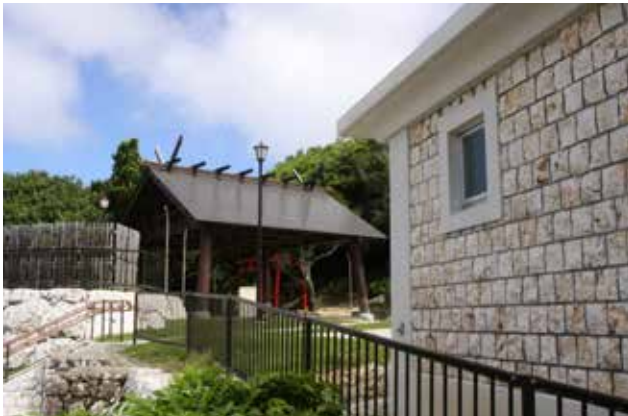
金刀比羅宮の和風の相撲檣と 島産ドロマイト石材を使用したトイレ