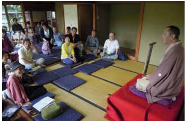
湘南邸園文化祭@横須賀市、万代会館 地域で親しまれる歴史的建造物での寄席の様子