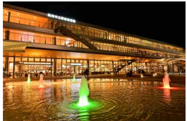
夜のライトアップ 電気は全てコンビナート電力を活用している