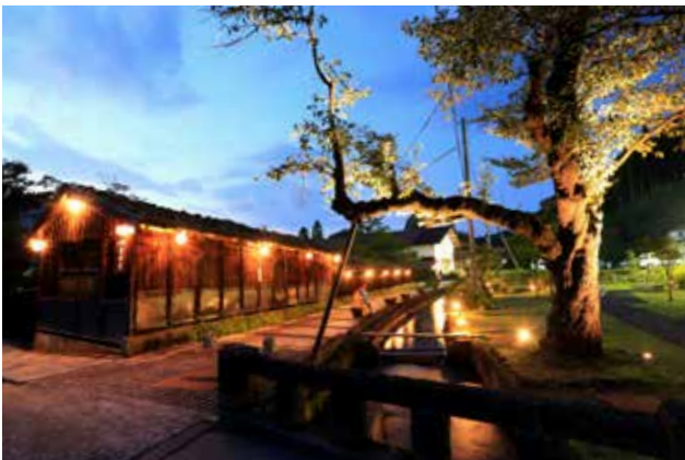
金山町の景観の象徴でもある大堰公園周辺の風景 水路（大堰）沿いの光と保存樹の光

50年以上にわたって街並み景観づくりに取り組んできた金山町は、公民連携、大学との協働、地場産業との関わりなど、常に最先端を走ってきた。本活動における夜間景観づくりはそれをさらに前に進めるものである。全額補助のワークショップではじめてのランプシェードの製作は、人づてに技術が伝承され、いまや役場では正確な設置数わからないという。金山住宅を普及させたこの地らしい話である。住民の方に話を聞くとひとつひとつの照明に思い入れがある。東京から来た学生は照明設置や維持管理をサポートし、全体計画や公共施設への光設置を担っており、住民と大学との協働関係が成立している。手づくりのランプシェードは街灯と違って人の気配を感じさせる。訪問した日は冷たい雨がふる暗い夜だった。雨で光る路面に反射した小さな灯りの群れは、街並みを明るく照らすほどではなかったが、金山のみなさんの暖かさと美意識を表しているようだった。(福井)