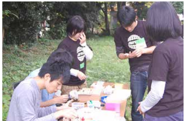
湘南邸園文化祭@藤沢市、旧モーガン邸庭園 大学の研究室による間伐材を用いた時計作成のワークショップの様子