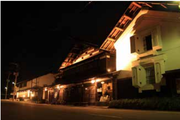
手前は民有地の蔵、中央は店舗兼住宅、奥は銀行 軒下には手作りのランプシェードが灯り、 漆喰の壁面はライトアップされる