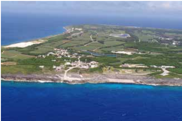
島の西側から見た対象地区（字港周辺） 手前の西港に隣接し、燐鉱山に由来する集落を形成している

北大東島は、珊瑚礁が隆起してできたドロマイト（海水で変容した石灰岩）の土地に海鳥の糞が化石化してできたグアノ（燐を多く含む物質）が堆積しており、大正時代から昭和初期にかけて燐鉱石の採掘が行われていたという歴史をもつ。燐鉱山遺跡と集落の街区構成、およびその周囲に広がる採掘場跡や畑地の景観が今もなお残る地区は平成30年に国の重要文化的景観に選定されており、当時の生産施設や居住施設が残されている。島では、平成17年以降の文化財調査を行って遺構、歴史文化の保全継承に向けた行政、島民、地元団体等による各種の取組が行われており、屋根勾配を緩やかにした建築様式と島の天然資源であるドロマイト石材による組積造建造物や敷地周囲の石垣を基調とする景観は、平成27年策定された村の景観計画に位置付けられ、新たな漁港施設や祭り広場の修景整備、「うみんちゅ住宅」にも引き継がれていること。さらに、一連の景観に対する取り組みは、村のアイデンティティ醸成や定住促進、地域活性化に寄与していることが認められた。以上のことから、優秀賞に相応しいと評価された。（池邊）