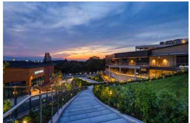
商業施設の屋上緑化から公園と融合する パークプラザと鶴間公園を眺める