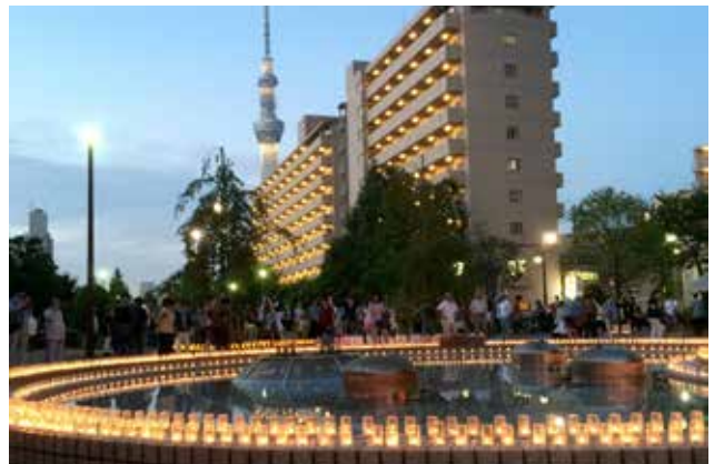
灯のイベントの開催 子供達と一緒にろうそくの火を灯す