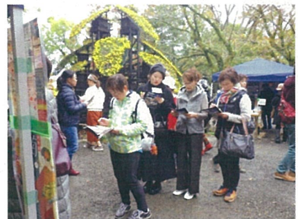
イベント開催状況