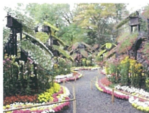
三島市立公園楽寿園