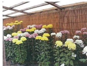
沼津御用邸記念公園