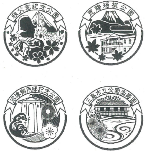
スタンプラリーデザイン