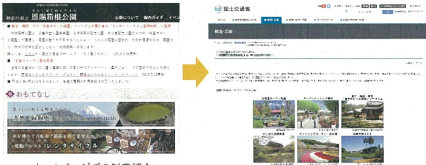
ホームページでの制度紹介