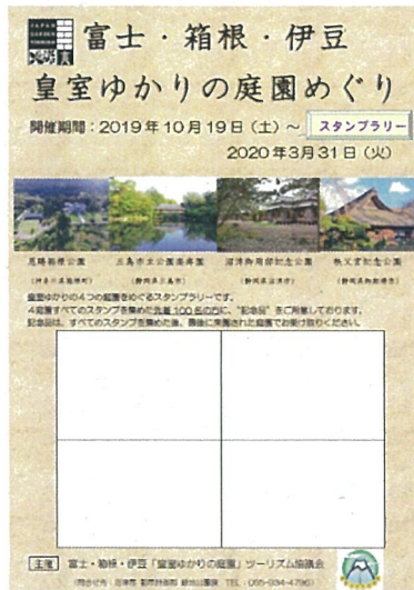
スタンプラリー台紙