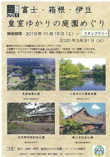
スタンプラリーポスター