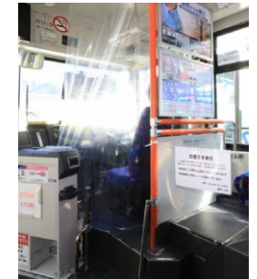
バス運転席仕切りカーテン