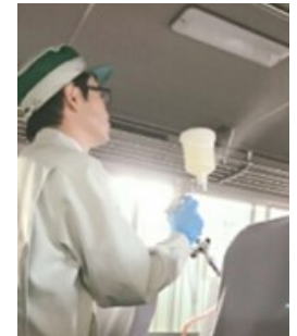
車内の抗菌・抗ウイルス対策