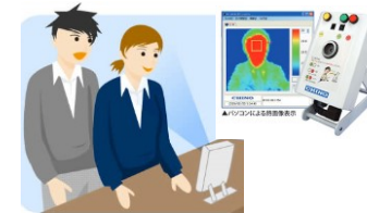
熱感知カメラ設置による感染者の公共交通利用自粛励行