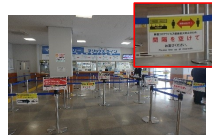
ターミナル等の衛生対策