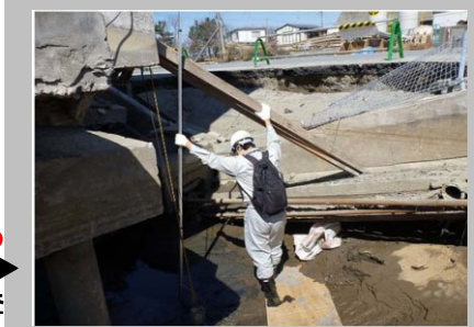
災害発生時の営繕部局の役割の例 官庁施設の被災状況調査