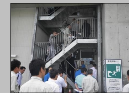
施設管理上の対策の例 津波避難ビルに指定された庁舎での避難訓練