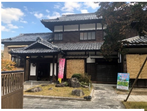
(市の施設「城下町観光交流館」)