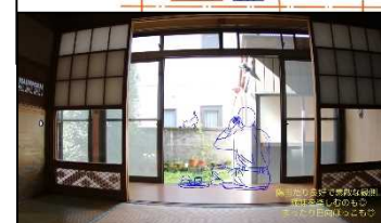
▲追加コンテンツ一例

小山市空き家バンク専用のサブサイトを作成した。さらに、より魅力的に物件を紹介するため、小山工業高等専門学校と連携し、建築学科の学生による追加コンテンツとして、リフォーム案やライフスタイル案を掲載することで、中古物件に対する興味を高め、空き家利活用を推進する。