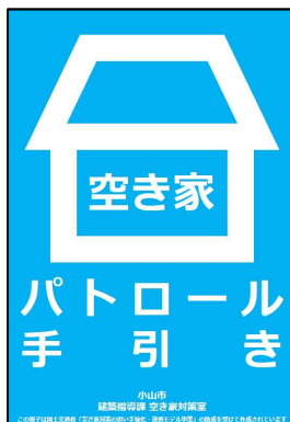
▲空き家パトロール手引き