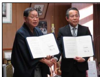
▲小山警察署との協定締結

また、小山警察署と空家等対策に関する協定を締結し、地域住民で構成される警察関連団体に「空き家パトロール」の周知・協力をいただけることとなりました。