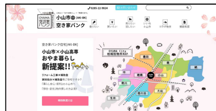
▲サイトトップページ ▼追加コンテンツ掲載画面