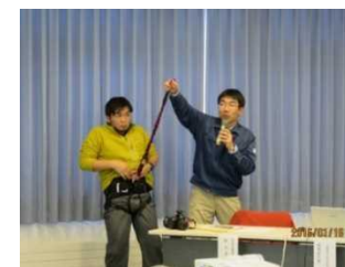
雪下ろし安全講習会