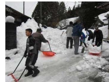
除雪ボランティアによる除雪活動