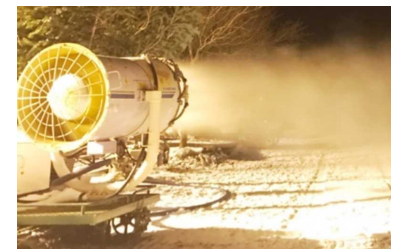
高機能な降雪機の導入により、営業期間を最大化・明確化