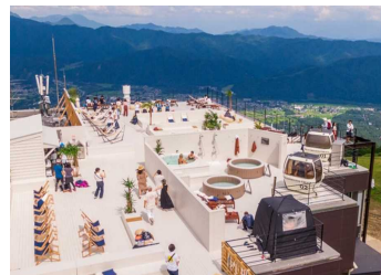
グリーンシーズンも楽しめる環境を整備し、通年での誘客を促進