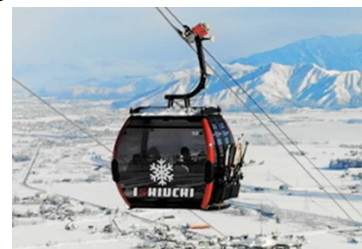
索道の再編や搬器の大型化・高速化により、混雑を改善し、快適性・満足度を向上