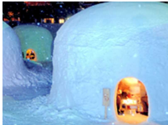
アフタースキーを楽しめる環境を整備し、外国人観光客の長期滞在を促進