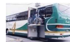
【リフト付きバス】 (乗車定員30人以上)