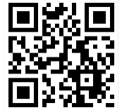
ポータルサイトへ！

中大規模木造建築ポータルサイト(令和3年2月17日開設)により、中大規模木造建築に関する知識・技術の習得に役立つ情報(設計技術情報、講習会情報等)や、木造建築の実現にあたりビジネスパートナーを見つけるために役立つ情報(担い手・サプライチェーン情報)、設計者相互の情報交流の場(相談箱)等のコンテンツを提供。