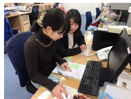
正社員・パートの両方で、産休・育休制度や短時間社員制度を活用し復帰された方が何名もいます。復帰後また活躍されている先輩社員を見ると、自身のモチベーションも上がります。

各人が自分を磨き、互いを高めあうことが、チーム（組織）としての結束力強化につながっています。