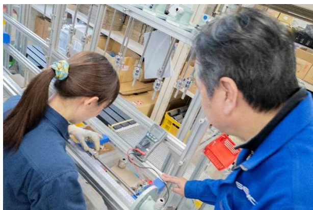
特に生産部門では実際に製品に触る機会が多く、女性でも船の中に入り製品の修理や点検を行う機会もあります。