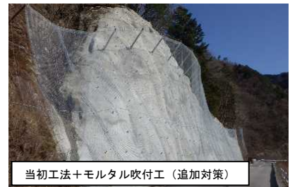
当初工法+モルタル吹付工（追加対策）

対策例②：緊急輸送道路の整備において、詳細な地質調査の結果、想定以上の強風化した岩盤が出現したため、推進費により追加対策を実施。