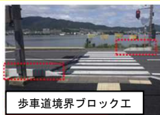
歩車道境界ブロック工

対策例：園児の移動経路（交差点）において発生した死傷事故を受けて、緊急点検の結果、危険箇所には防護柵等を設置。