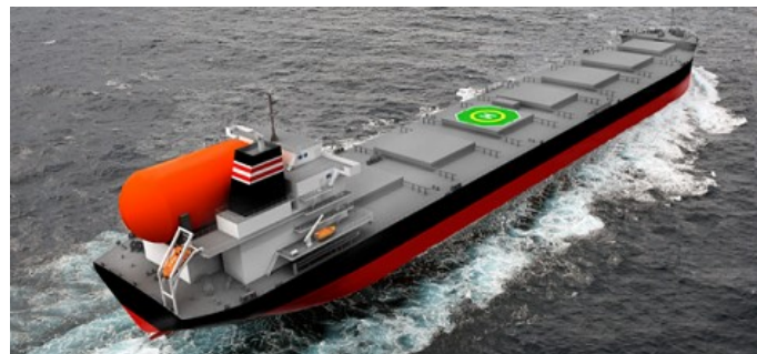
本船イメージ図（航行中）