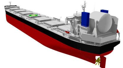
LNG燃料ばら積み貨物船「KAMSARMAX GF」イメージ