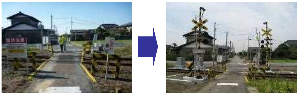
図29：遮断機・警報機の整備