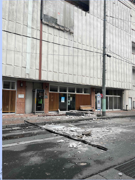
県道で発生した落下物（外壁剥落）の状況