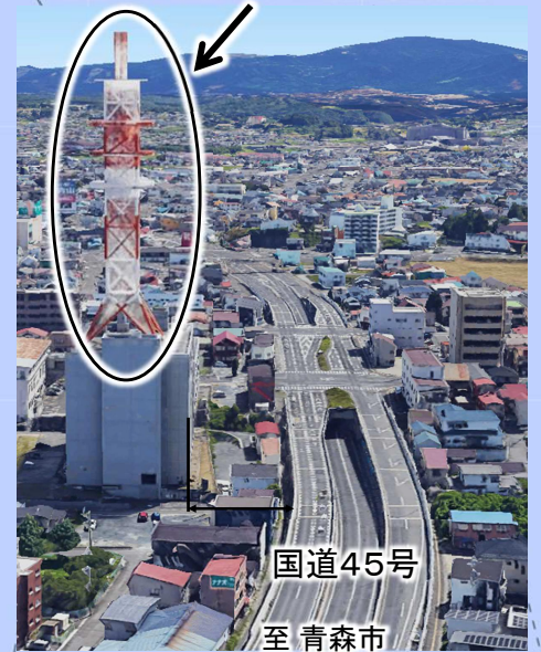
損傷が確認された沿道建築物