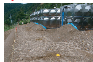
図 4.7 石渚簡易水道における被害