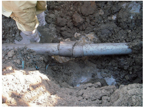
写真 4.8 呼び径不明 VP 継手部破損

呼び径 40, 300 での被害率は、管路延長が短いため（それぞれ 0.223km 及び 2.092km）、高い値となった。