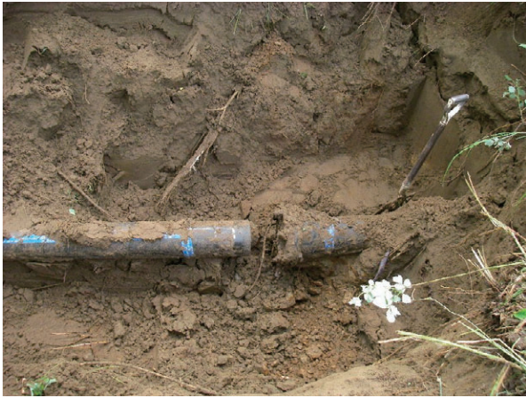
写真 4.7 呼び径 150 DIP 継手抜け