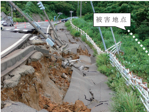
写真 4.4(1) 盛土部の斜面崩壊状況 [鯨波 1 丁目乙 1509 番地先]