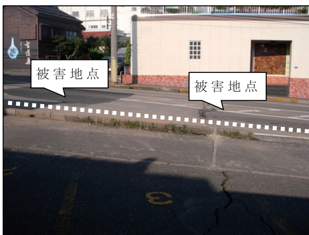
写真 4.6 砂丘斜面に埋設された管路 [東本町交差点付近]