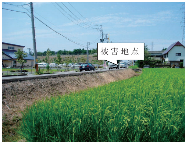
写真 4.5(1) 盛土地盤上での管路被害 地点(全景) [茨目地内]