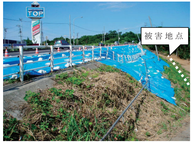
写真 4.4(2) 盛土部の斜面崩壊状況 [鯨波 1 丁目乙 1509 番地先]