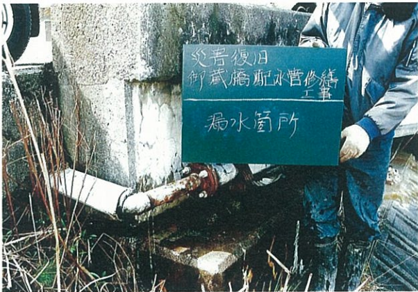
写真 5.13 橋台付近からの漏水