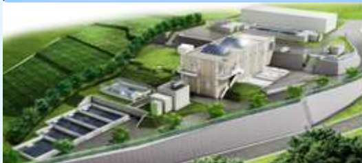
基山浄水場浄水施設更新事業 (佐賀東部水道企業団様)