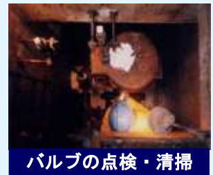
バルブの点検・清掃