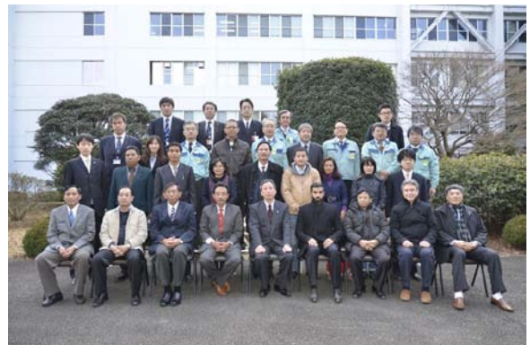
日立プラントテクノロジー（株）土浦事業所の視察