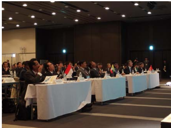
各国から参加された招聘者