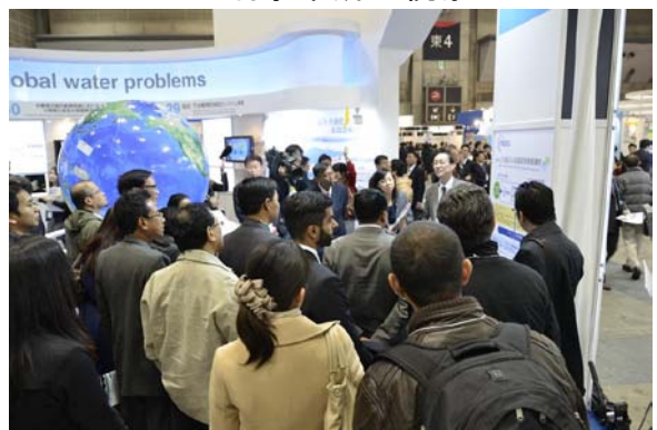
「第4回国際水ソリューション総合展（Inter Aqua 2013）」の視察