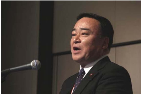
挨拶をする梶山国土交通副大臣