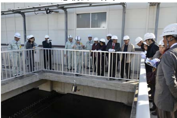
埼玉県・中川水循環センターの視察