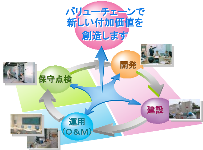
図 東芝グループバリューチェーン