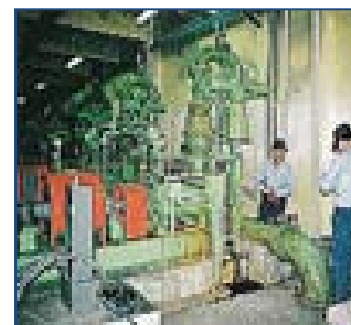
巡視点検（ポンプ場）