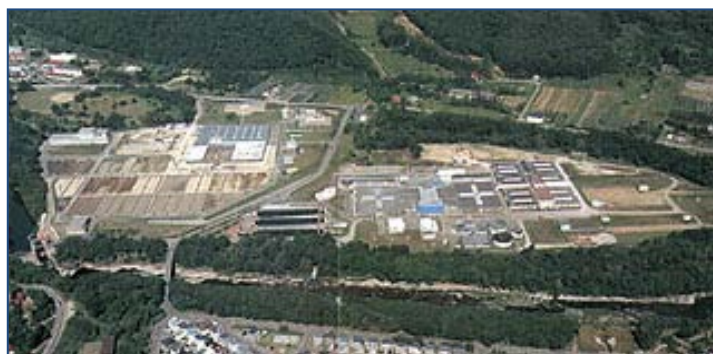
東北以北最大規模の白川浄水場

※ 当別浄水場の運転管理業務 当協会は、平成24年7月に石狩西部広域水道企業団から業務を受託し、平成25年4月からの本格稼働に向けて試運転を行っています。新たな当別ダムからの小樽市、石狩市、当別町への広域的な安全・安定給水に札幌市水道局と連携して貢献します。