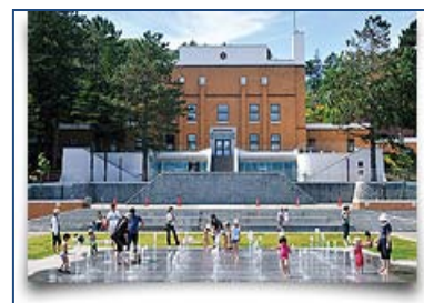
札幌市水道記念館

日本水道協会などが主催する水道技術者養成のための講習会について、運営管理を行っています。