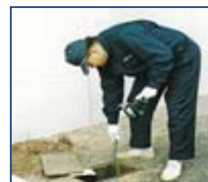
水道メーター検針