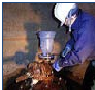
管路点検（幹線弁室）

配水池、ポンプ場及び送水施設（トンネル）の施設・設備の巡視点検などを行い、異常等を早期に発見できるように維持管理しています。