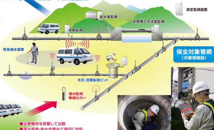
測定用ピットと監視装置