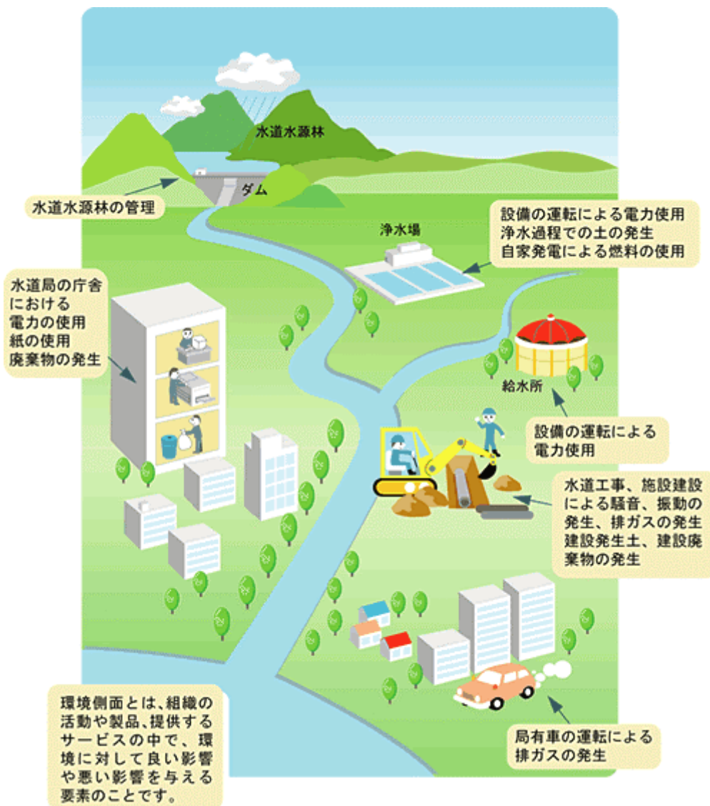
図 2-2-1 水道事業の主な環境側面の例 1)