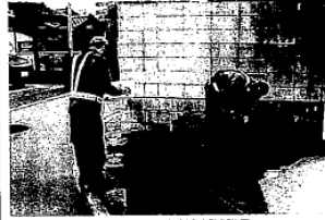
戸別給水調査を行う派遣職員