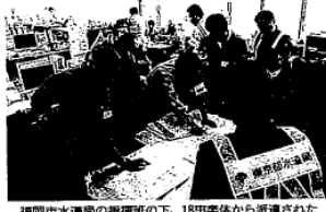
熊本市水道局の調査班の下、18名隊員から派遣された技術職員が漏水調査を実施

【熊本県熊本市】熊本市は24日、熊本市に38班の復旧班を派遣し、応急給水から復旧作業へと移行する。復旧班は、被災地区の水道管の調査、漏水の修理、給水設備の復旧などを行う。また、被災地区の水道管の調査、漏水の修理、給水設備の復旧などを行う。また、被災地区の水道管の調査、漏水の修理、給水設備の復旧などを行う。