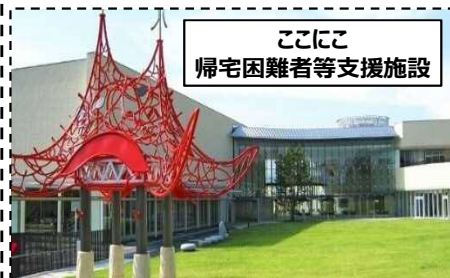
ここに帰宅困難者等支援施設