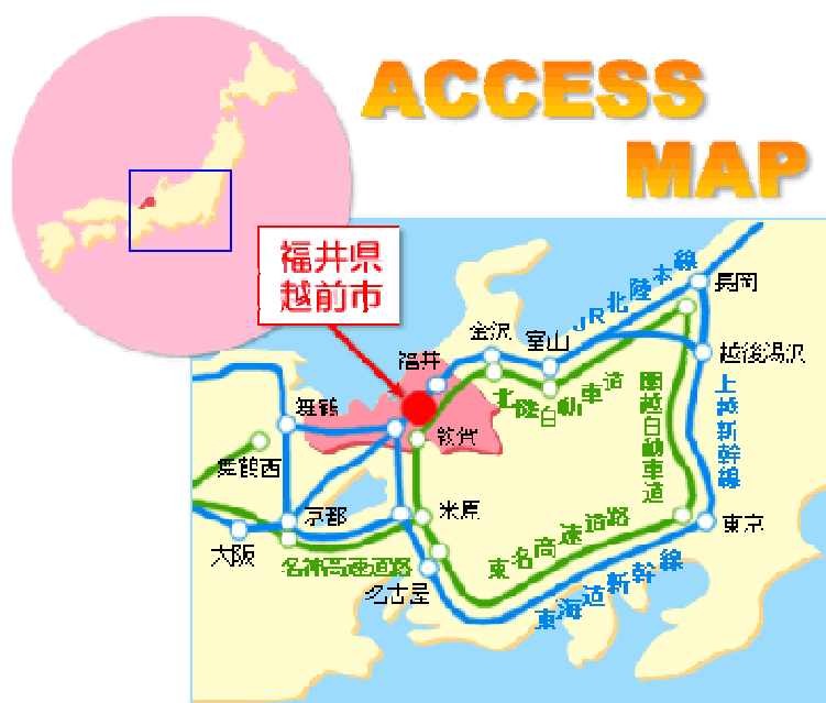
越前市の位置

市街地の現状に関しては、他の多くの都市に見られるのと同様、モータリゼーションの進展により旧市街地の空洞化が進んでいる。郊外に立地した大規模小売店の販売額が伸びている一方で中心市街地の商店街の売り上げは減少を続け、閉鎖する店舗も増加してきた。このような状況に対し、越前市では地元商業関係者と行政との連携の下、伝統文化や観光に重点を置いて中心市街地の活性化を図ってきている。本稿で採り上げる「蔵の辻」はそのような動向の中でとりわけ先進的な取り組みが行われた事例である。