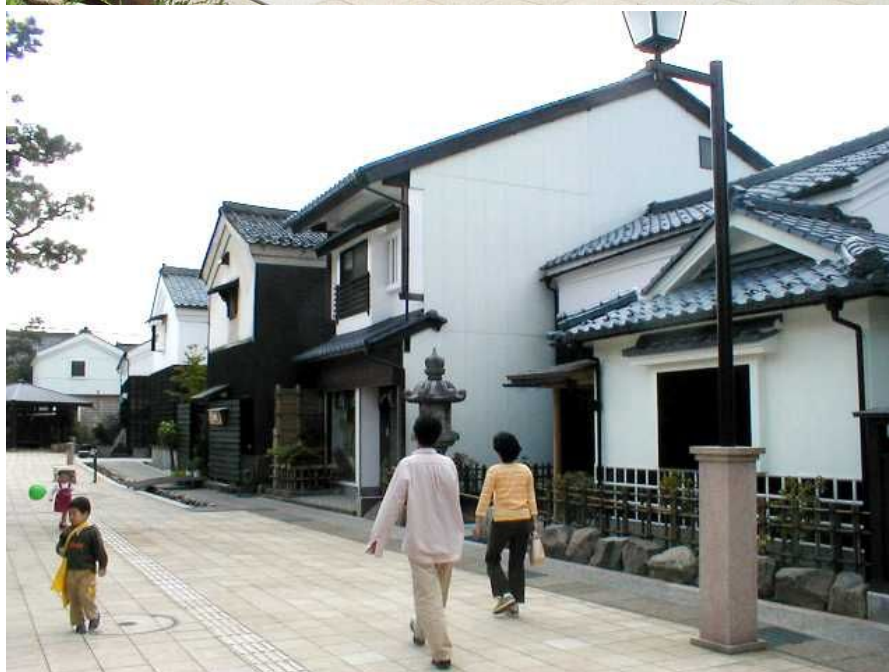
「蔵の辻」の風景