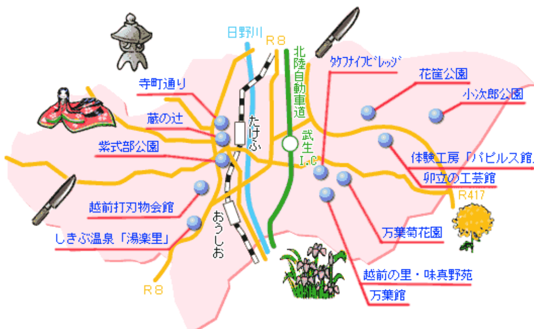
越前市の観光スポット (資料:越前市)