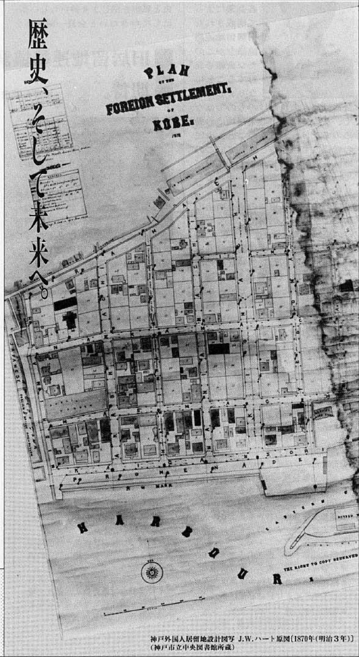
神戸外国人居留地設計図写 J.W.ハート原図(1870年(明治3年)) (神戸市立中央図書館所蔵)

● ジャパン・クロニクル発行の居留地50年史、「ジュビリーナンバー1868-1918」（神戸市立博物館所蔵）より英文引用、訳文は、神戸新聞出版センター発行「神戸外国人居留地」を参照させていただきました。