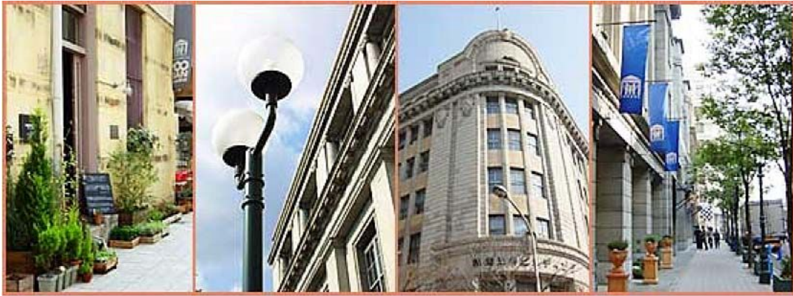
旧居留地の風景（資料：旧居留地連絡協議会のホームページから）