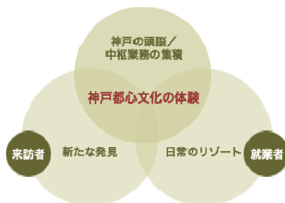
都心づくりの方向（資料：旧居留地連絡協議会ホームページ）

神戸の中核業務地としての地位を将来にわたって維持し、マルチメディア都市の中核として、これまで培ってきた神戸の都心文化を未来に引き継がなければならない。この都心文化は、業務機能の高密度・高品質な集積を基盤として、さまざまな人々が集うことから醸成される。ここで働く人にとっては毎日が新鮮で楽しめる環境を、そして訪れる人には新たな発見と出会いを可能とする環境を用意することによって、多様な交流が始まり、深まる。（旧居留地連絡協議会ホームページより）