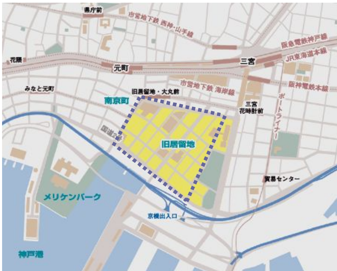
旧居留地地区

神戸市は1995年の阪神淡路大震災で甚大な被害を被ったが、その被害は建物の倒壊等の直接的な被害にとどまらずその後の経済的な被害にまで及んだ。震災を機に神戸支店の東京・大阪等本支店への吸収統合が急速に進んで事業所数・就業者数が激減するとともに、消費の減少、交流人口の減少などが見られるようになったからである。そして、旧居留地もこのような現象から免れることはできなかった。同地区においても、震災による建造物破壊と事業所撤退の両面で地区の衰退が危惧されるようになった。