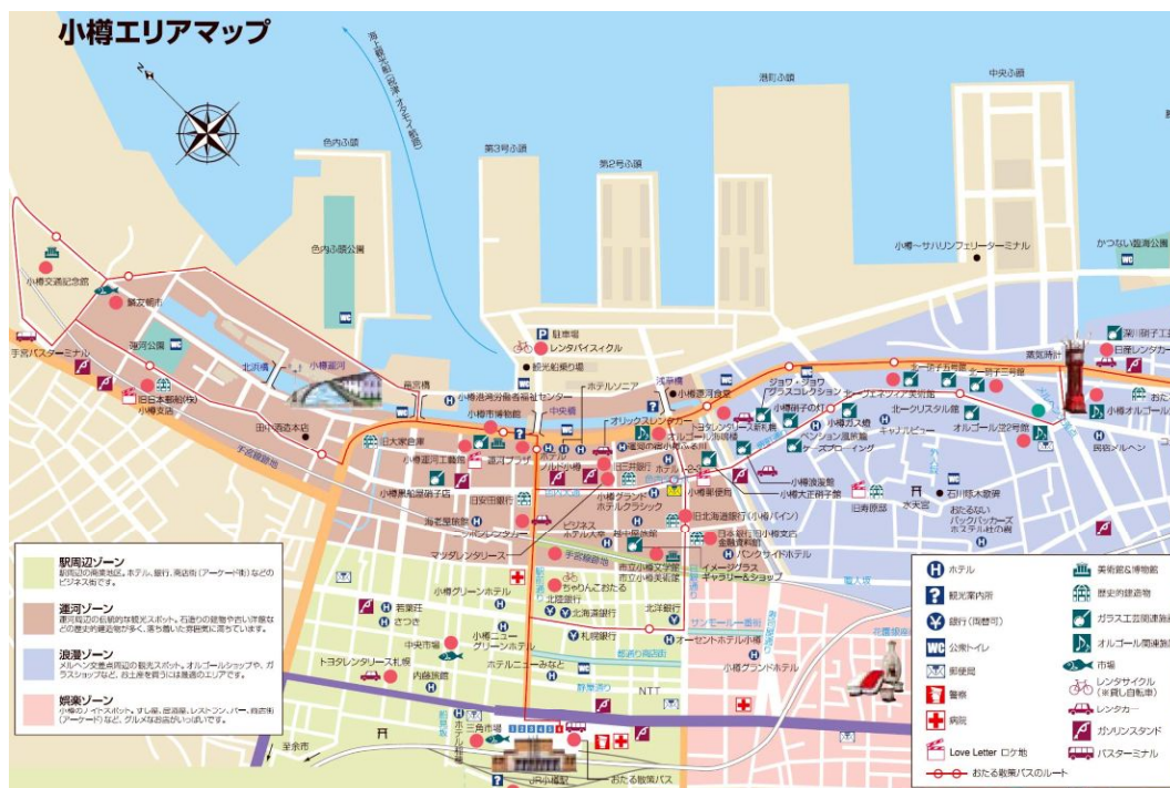
小樽市中心部地図

「小樽再生フォーラム」設立趣意書は、「小樽市の再生と活性化を目指す様々な試みがなされる中で、市民一人ひとりの知恵と力を小樽再生に向けて結集し、美しい自然環境と豊かな歴史的遺産を損なうことのない小樽再生のまちづくりを語り合い、また、その実現に向けて運動をすすめる」としている。