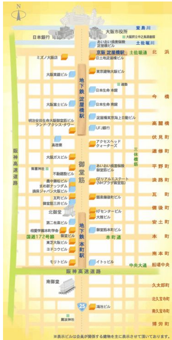
「御堂筋まちづくりネットワーク」会員の建物配置

「御堂筋まちづくりネットワーク」の活動対象エリアは土佐堀川から博労町通りまでの御堂筋沿道街区である。南側エリアには「長堀 21 世紀計画の会」が既に存在していたこと、また、ビジネスエリアでの連携を図ることが目的であったことから、このようなエリア設定となった。会員は御堂筋沿道の不動産(土地、建物)オーナーに限定しており、設立時は会員数 25 であった。2006 年春現在の会員は 36 にまで増加している。(社)関西経済連合会は不動産オーナーではないが、特別会員として参加している。