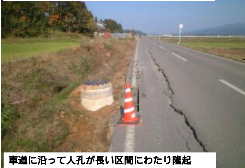
車道に沿って人孔が長い区間にわたり隆起