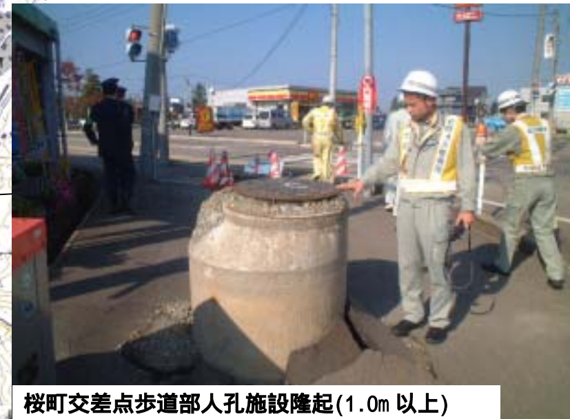
桜町交差点歩道部人孔施設隆起(1.0m 以上)