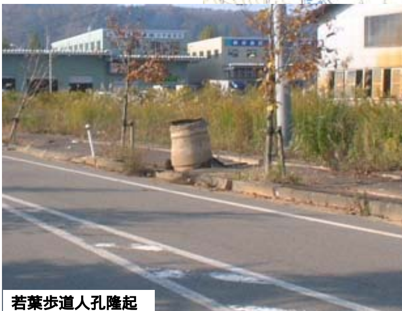
若葉歩道人孔隆起