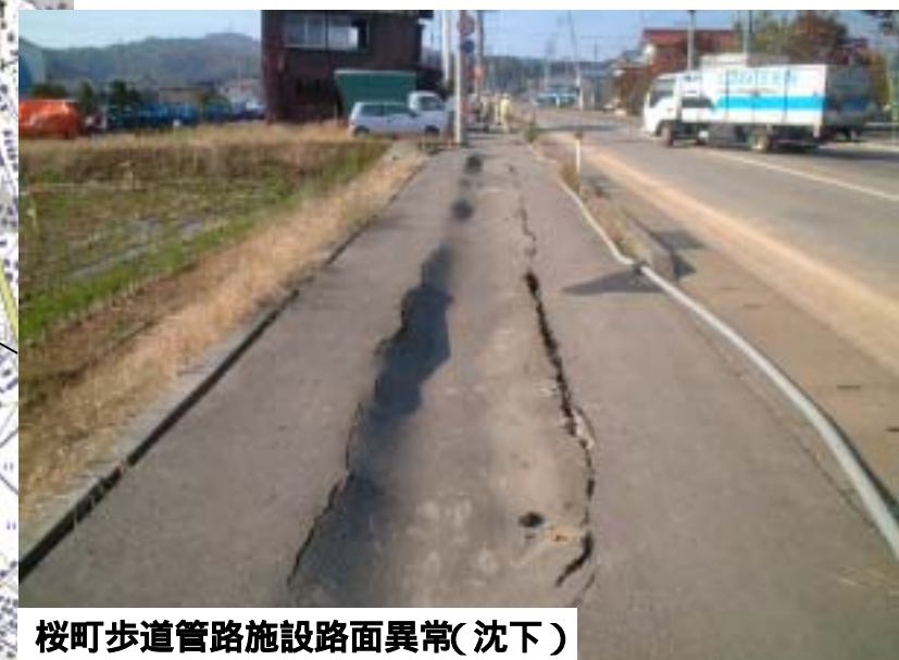
桜町歩道管路施設路面異常(沈下)