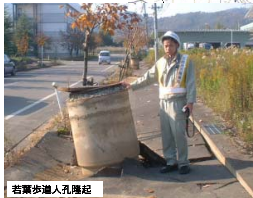
若葉歩道人孔隆起