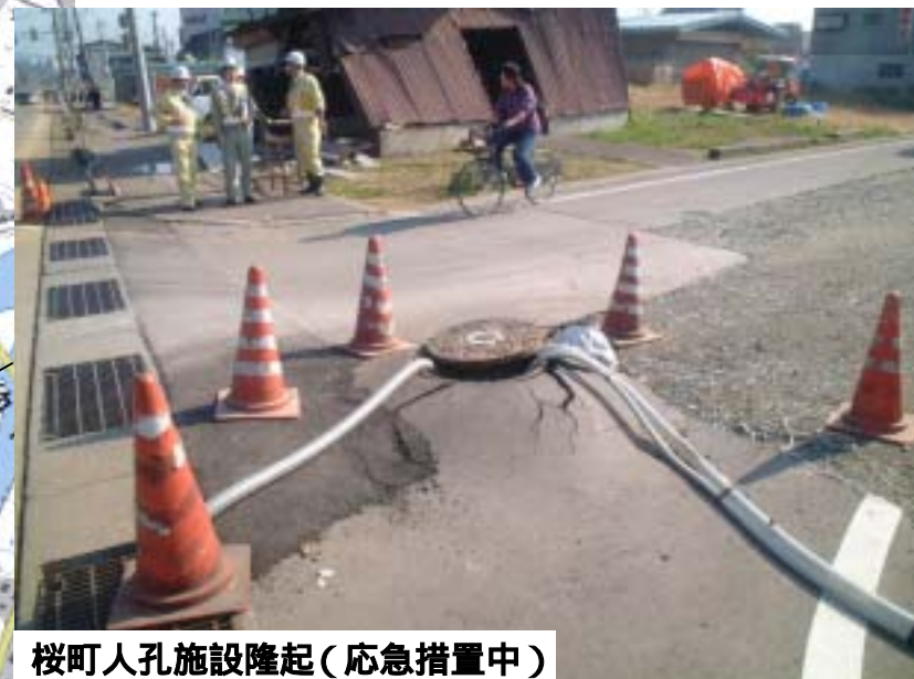
桜町人孔施設隆起（応急措置中）