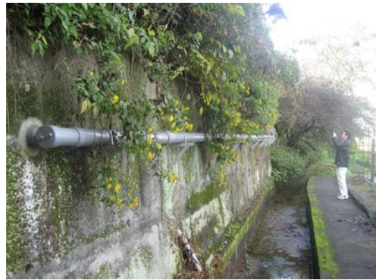
写真-1 クイック配管

下水道管きよの多くは地中に埋設されている。埋設管は、下水性状の変化が少ない、交通を初めとする都市活動に与える影響が小さい、故意による損傷が防止できるなどの利点がある。しかし、道路より低い位置に住居がある場合には、ポンプ設備を新たに設けたり、本管を深く埋設したりする必要があることからコストが割高になるため、民地や水路空間を利用して、管きよを地上に配管する方法（クイック配管）が提案されている。